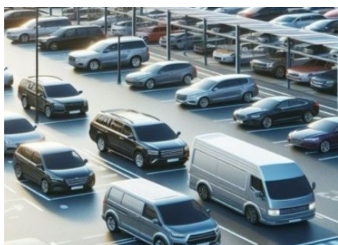
Point marché par AAA DATA