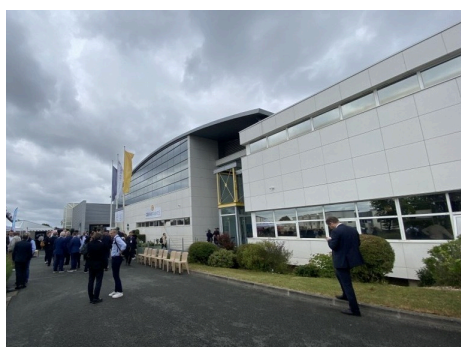
Salon des partenaires CESVI FRANCE