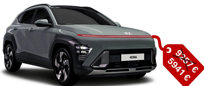
Communication Hyundai Kona II juin 2024